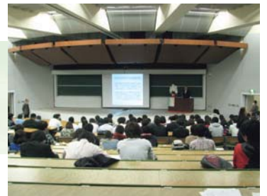
インターンシップ・ガイダンス(朝日大学)

各学校で4月から始まる、インターンシップやキャリア関連講座等との連携を行いました。岐阜県でインターンシップに参加する際には、協議会のウェブサイトや事前講習会、マッチング会等が利用できることなどをPRし、メール配信などを行う「学生会員」への登録を呼びかけました。