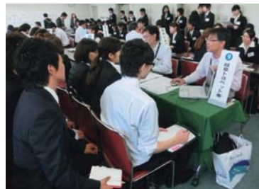
企業ブースの様子